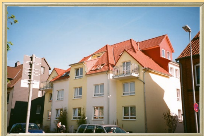
Wohnhaus Hildesheimer Straße

Rund 30 Quadratmeter große Appartements mit eigenem Bad sichern die Privatsphäre. Anschlüsse für TV und Telefon sowie eine Notrufanlage sind obligatorisch. Die eigenen Möbel ermöglichen die Umsetzung individueller Vorstellungen von Wohnlichkeit. Das gemeinschaftliche Wohnzimmer wartet auf Ihren persönlichen Fernsehsessel!