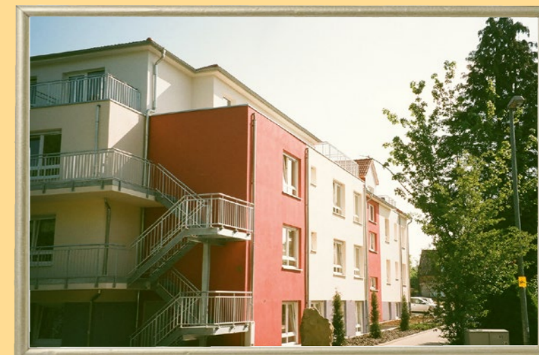
Wohnhaus Liegnitzer Straße