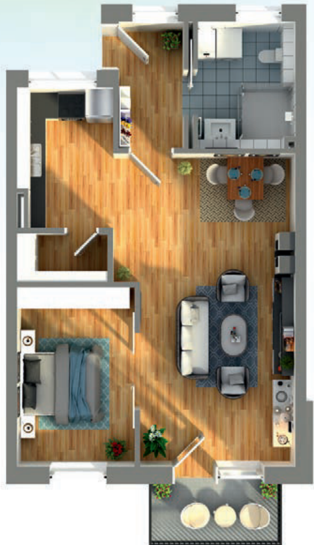
Ansicht einer möglichen Möblierung