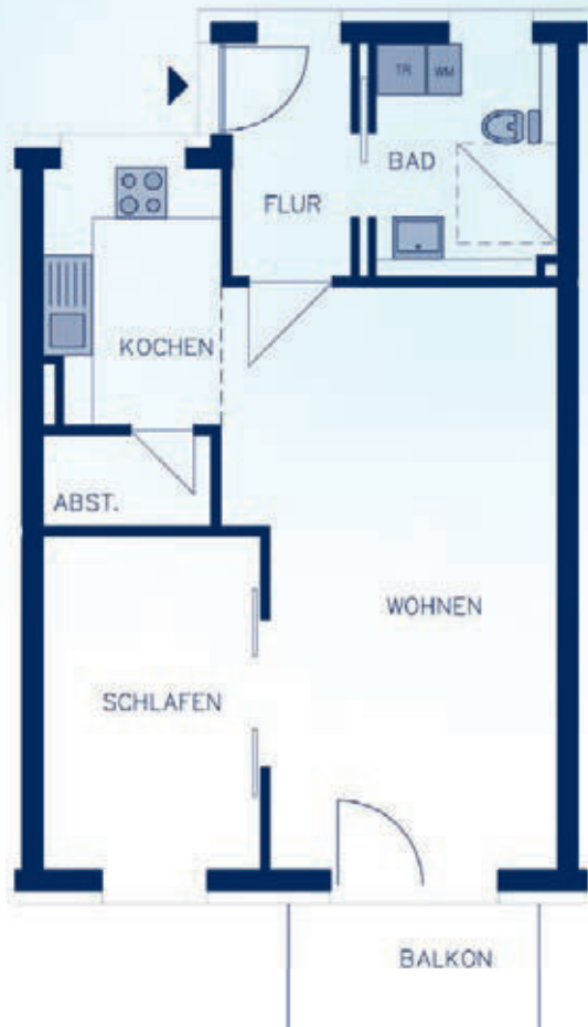
Maßstabgerechter Grundriss (1 cm = 1 Meter)