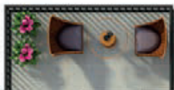
Ansicht einer möglichen Möblierung