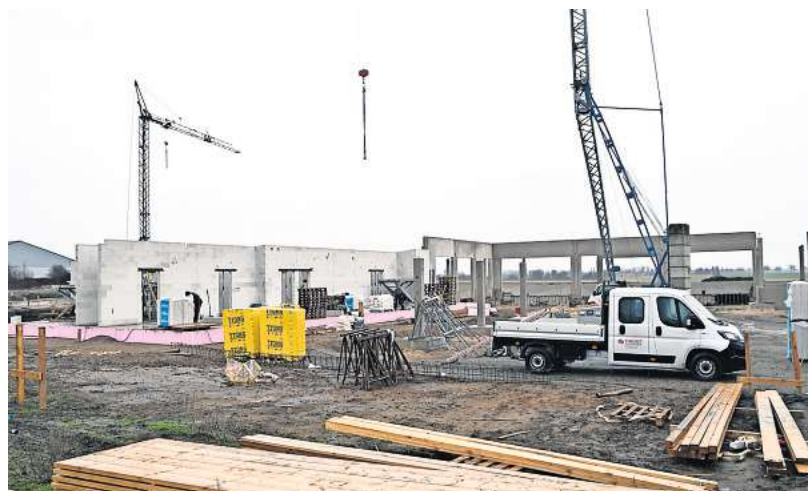
Eine der großen Investitionen der Gemeinde Söhlde ist der Bau des Bauhofes in Hoheneggelsen.